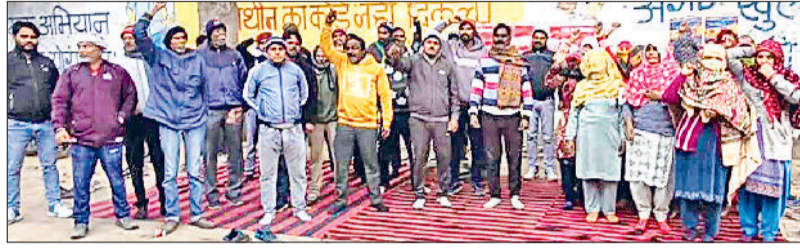
महेंद्रगढ़। सरकार व प्रशासन के प्रति नारेबाजी करते कर्मचारी।

हुए सफाई कर्मचारी यूनियन के कर्मचारियों ने कहा कि कई बार नगर पालिका प्रशासन को अवगत करवाया जा चुका है कि स्थानीय नगर पालिका के कर्मचारियों को 2017 से 2023 तक का एरियर बकाया है। वहीं, यहां के कर्मचारियों को समान काम समान वेतन नहीं दिया जा रहा है। जबकि, प्रदेश की अन्य पालिकाओं और परिषद में समान काम समान वेतन मिल रहा है। यूनियन के कर्मचारी कई बार ज्ञापन के माध्यम से भी नगर पालिका के अधिकारियों व विधायक तक को अवगत करवा चुके हैं कि कर्मचारियों का बकाया एरियर जल्दी दिया जाए, लेकिन अभी तक उनको एरियर नहीं मिला है। जिसके चलते उन्होंने