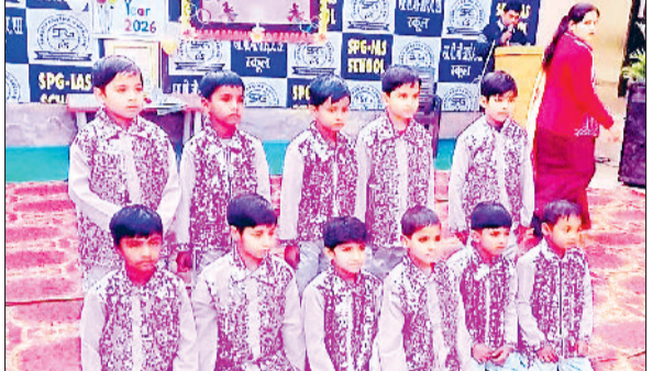
महेन्द्रगढ़। कार्यक्रम में अपनी प्रस्तुति देते विद्यार्थी।