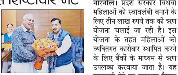
नारनौल। भाजपा राष्ट्रीय अध्यक्ष नितिन नबीन से मिलते विधायक ओमप्रकाश यादव।

विधायक एवं पूर्व मंत्री ओमप्रकाश यादव ने शुक्रवार को भाजपा के राष्ट्रीय अध्यक्ष नितिन नबीन से शिष्टाचार भेंट की। इस मुलाकात के दौरान विधायक यादव ने उन्हें राष्ट्रीय अध्यक्ष का महत्वपूर्ण दायित्व मिलने पर बधाई दी और नववर्ष की मंगलकामनाएं दीं। विधायक ओमप्रकाश यादव ने बताया कि विगत बिहार विधानसभा चुनाव के दौरान पार्टी नेतृत्व ने उन्हें बिहार में प्रवासी प्रभारी की जिम्मेदारी सौंपी थी। उस समय उनकी ड्यूटी नितिन नबीन के विधानसभा क्षेत्र बांकीपुर में लगी थी। विधायक यादव ने कहा कि नितिन नबीन एक मिलनसार