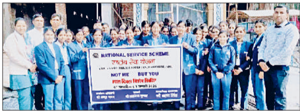
महेन्द्रगढ़। अभियान के दौरान उपस्थित विद्यार्थी।