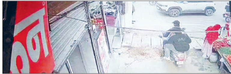
नारनौल। सीसीटीवी फुटेज में आरोपित।

इसके बाद वे उसके लड़के को दयानगर में खेतों में लेकर गए। जहां पर उन्होंने उसके लड़के