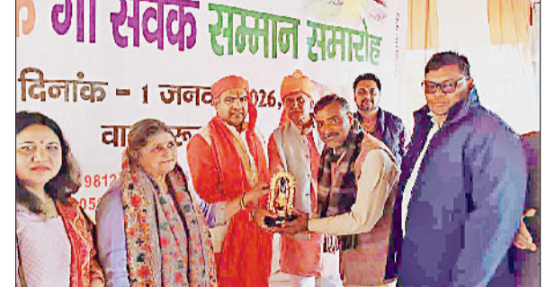
नारनौल। कार्यक्रम में गोसेवकों को सम्मानित करते हुए।

अतिथियों ने गोसेवकों को प्रोत्साहित करने के लिए पटका ओढ़कर सम्मानित किया