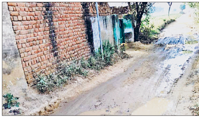
नांगल चौधरी। सड़क निर्माण अटकने से आम रास्ते में बनी जलभराव की स्थिति।