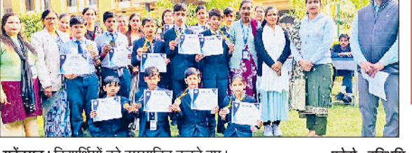
महेन्द्रगढ़। विद्यार्थियों को सम्मानित करते हुए।