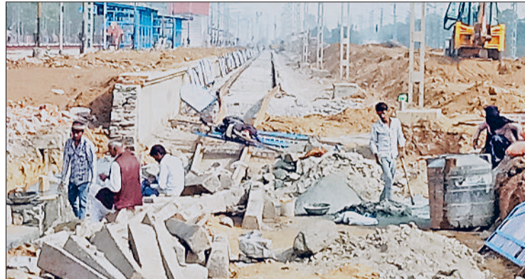
नारनौल। रेलवे ट्रैक तैयार करते इंजीनियर एवं मजदूर।

उल्लेखनीय है कि रेलवे विभाग ने वर्ष 2007 में मीटरगेज लाइनों के ब्रांडगेज में तब्दील करना शुरू किया था, तब से केवल सिंगल ब्रांडगेज लाइनें ही तैयार की गई थी, जिस कारण एक ही पटरी पर आगने-सामने से ट्रेन आने पर एक ट्रेन को रेलवे स्टेशन पर रोक दिया जाता था और दूसरी ट्रेन को पार कराया जाता था। इसका शिकार अक्सर छोटी दूरी की ट्रेनें होती थी और छोटी दूरी के यात्रियों को