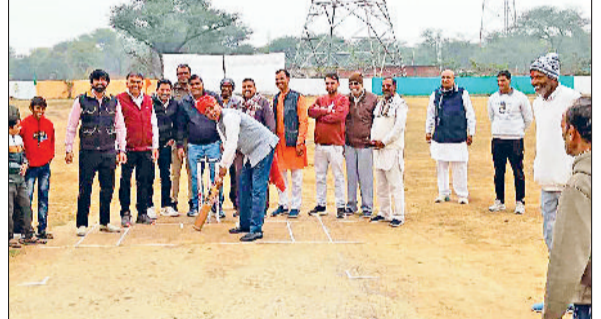
महेंद्रगढ़। खेल प्रतियोगिता का शुभारंभ करते विधायक।